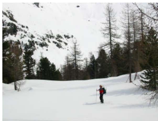
...la magia del bosco e della neve !