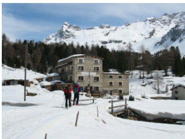
Il rifugio Saoseo e ...

Raggiunti dei ripiani detritici, si tocca infine il Passo di Val Viola posto fra due altri laghi glaciali d'alta quota: sul versante opposto si apre la lunga e maestosa Val Viola Bormina. A questo punto è possibile tornare per la via seguita oppure, dopo aver magari raggiunto la panoramica cima del Moton, si può puntare dapprima verso Ovest e poi scendere per tracce su ripidi pendii erbosi fino a rientrare nel sentiero di salita. Un'altra alternativa consiste nel prolungare la traversata verso Ovest entrando nella già citata vallecola ove scorre l'immissario del Lago di Val Viola e scendere su traccia di sentiero lungo di essa . In caso di forte innevamento questi ultimi itinerari risultano essere comunque i più sicuri anche in salita.